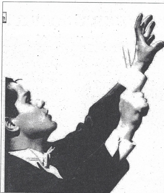
L'immagine simbolo del festival

trova anche l'Ensemble San Felice che proporrà un repertorio di musica antica con l'Offerta Musicale di Bach e un Oratorio di Giacomo Carissimi - che si alterneranno sul palco per un totale di ventun concerti dove risuoneranno i brani di Mozart, Beethoven, Debussy, Bach, Dvorak, Tchaikowsky, Rachmaninov. Ma Firenze sarà solo la prima tappa di un lungo tour che toc-