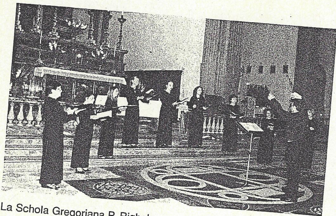
La Schola Gregoriana P. Righela

Si è formato ai corsi dell'Associazione Internazionale Studi di Canto Gregoriano di Cremona con i Professori Albarosa, Göschl, Pouderoijen e Turco. Vincitore del concorso nazionale a cattedre per i conservatori, è docente titolare in organo complementare e canto gregoriano.